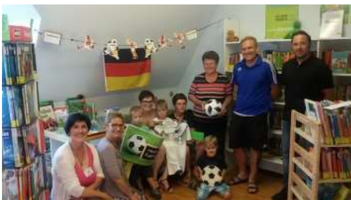
Preisverleihung beim WM-Quiz und Abschluss zur Kirchturm-Leseaktion