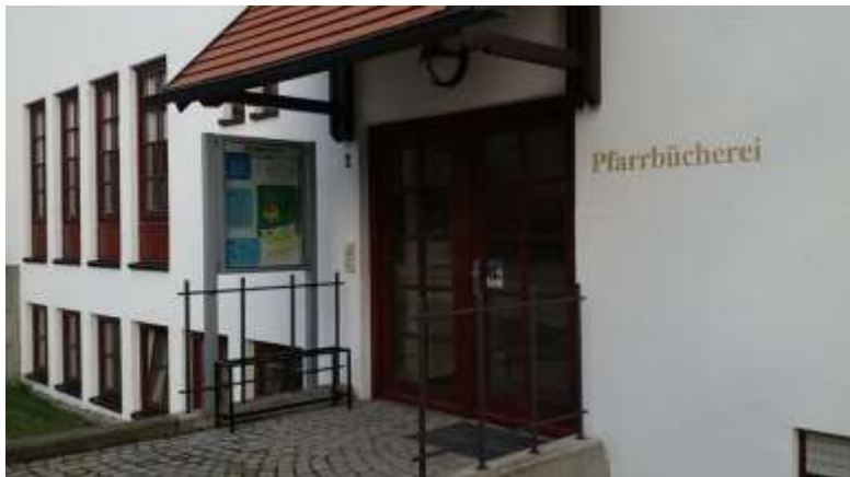
Eingang zur Bücherei in der Pius-Mozet-Straße: